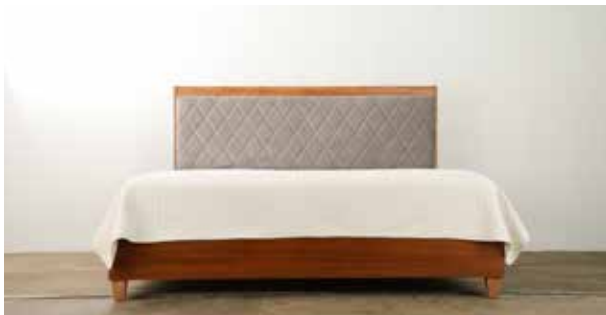
Cama King María