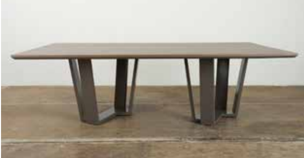
Mesa de comedor Santiago 48" X 94" X 30" H