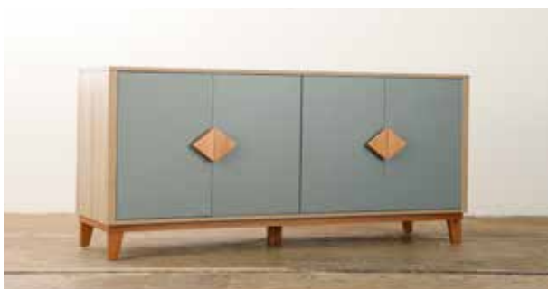
Mueble Auxiliar Bahía