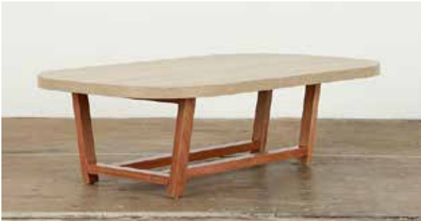
Mesa de centro Vega 50" x 30" x 15"H