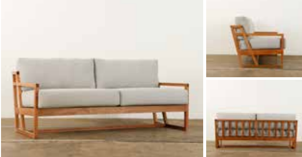
Sofá New York 3 plazas