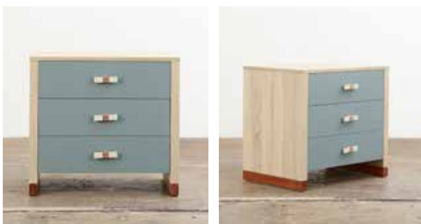
Mesa de noche