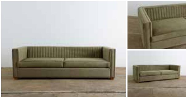
Sofá Caitlin 86"