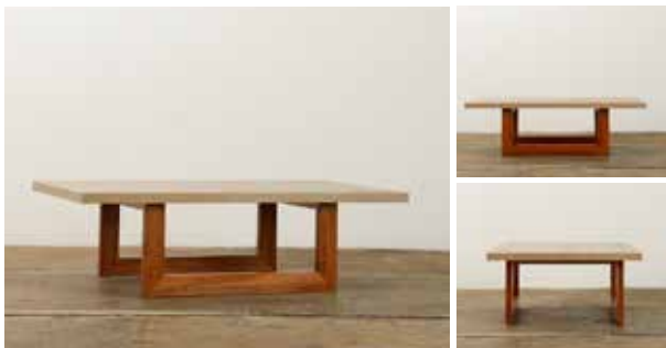
Mesa de centro Imbert 50" X 30" X 25"H